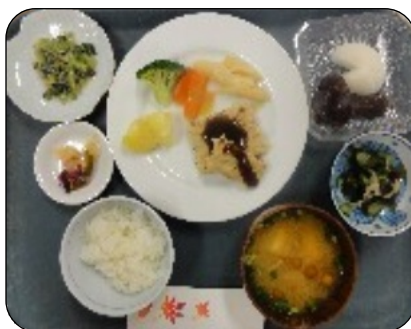
ある日の昼食 手作りさつまいもコロケ &デザートは ぜんざい

入浴、送迎などありませんが 旬の食材を使った手作りの 昼食・季節の活動 が充実しています！