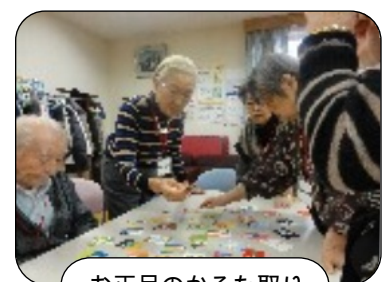
お正月のかるた取り