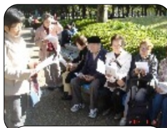
一日外出「世田谷美術館」

毎月第1・3水曜日 場所：松原ふれあいの家 11～15時 会費：700円 (昼食・おやつ付) * 8月はお休み