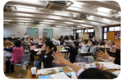
手話「手のひらを太陽に」

最後に会場の皆さんも一緒に「手のひらを太陽に」を手話を交えながら歌い、頭も体もフル回転で盛り上がりました。今年も皆様にご協力いただき開催できましたこと、お礼申し上げます 実行委員一同