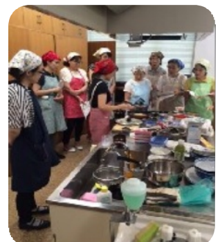
先生のデモを真剣に!